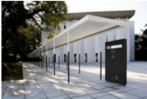
NURAP – SEDE C Dia: 08/03/2025 – SABADO

Eu, _____ portador do CPF _____ responsável legal do jovem _____ Portador do CPF _____, autorizo o mesmo a participar da atividade externa e complementar dirigida pelos monitores da instituição.