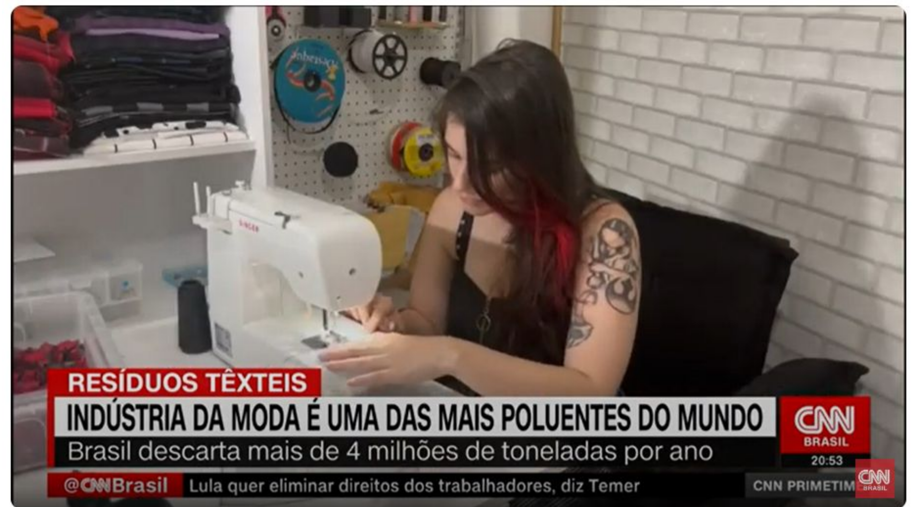
Indústria da moda é uma das mais poluentes do mundo | CNN PRIME TIME

https://www.youtube.com/watch?v=Bws4285rh98&ab_channel=CNNBrasil